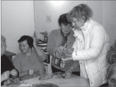
Kurz pletenia ponožiek a papuc