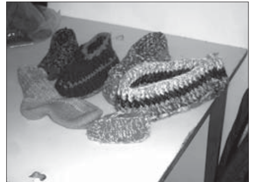
Výsledky kurzu pletenia ponožiek a papúč